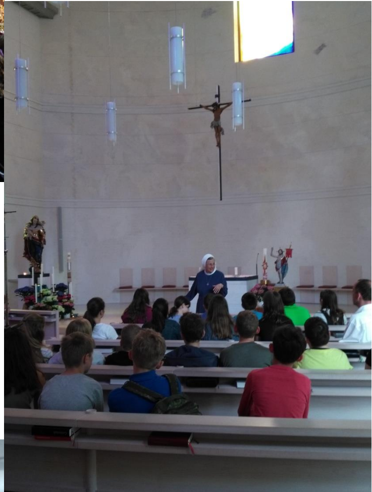
Sr. Michaela erzählt über den Bau der neuen Klosterkirche