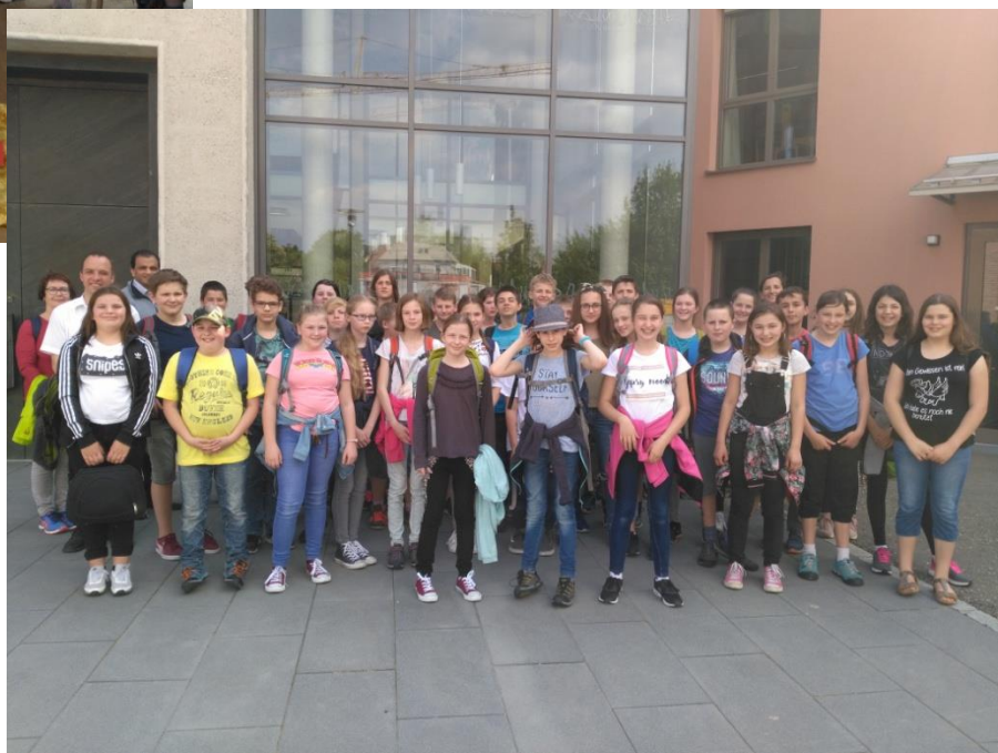
(Abschlussfoto vor dem Mutterhaus)